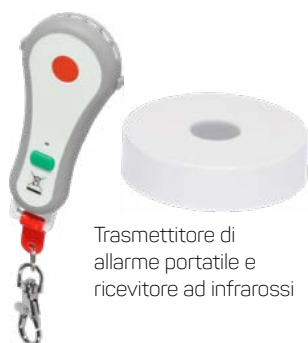
Trasmittitore di allarme portatile e ricevitore ad infrarossi