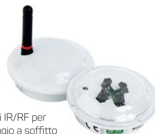
Ricevitori IR/RF per il montaggio a soffitto

I ricevitori del sistema di localizzazione in tempo reale (RTLS), possono essere facilmente collegati direttamente al terminale CT Touch. Questo consente una grande riduzione ed ottimizzazione dei costi, non dovendo provvedere all'aggiunta di una rete di cablaggio separata.