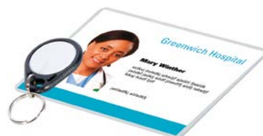
Tessera e TAG RFID

Il nostro terminale CT Touch è completo della tecnologia RFID (standard). La segnalazione della presenza, senza contatto al terminale, supporta la struttura nella prevenzione e nel controllo delle infezioni. Inoltre, tutta l'attività e tutti gli eventi, eventi, possono essere registrati automaticamente, per una successiva valutazione.